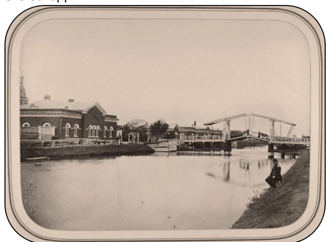
Белозерский канал и дом начальника дистанции, кон. XIX в.

С Белозерским княжеством связаны имена многих исторических персонажей и важные исторические события. На территории Белозерского кремля установлен знак Князьям Белозерским с дружиной, за подвиг в Мамаевом побоище на Куликовом поле. Прекрасно сохранившийся земляной вал относит нас во времена Ивана Грозного, когда по велению царя здесь была устроена «рублена сыпь с башнями и стенами» для укрытия в смутные времена. Помнит Белозерск и ссылку сюда новгородского колокола с вырванным «языком», и разорительное польско-литовское нашествие... Испокон веков Белозерск был поставщиком стерляди, осётра, снетка к царскому столу. Благодаря большим уловам белозерских рыбаков в XVII веке в городе и был устроен «государев рыбный двор». Интересна история о «переезде» города с места на место, связанная с вымиранием населения от моровой язвы ещё в XIV веке – из устья реки Шексны на настоящее местоположение, и факт переименования города из Белоозера в Белозерск и регулярный план застройки города во времена Екатерины II. Кажется, будто город хочет скрыть тайны, «запутать следы», и только археологи и учёные приоткрывают нам его загадки.