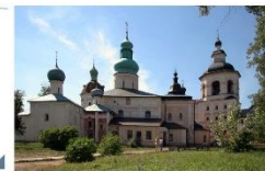
Успенский собор с папертиями

Одна из первых каменных построек Белозерского края, назовем лих начало монументальному строительству на русском Севере